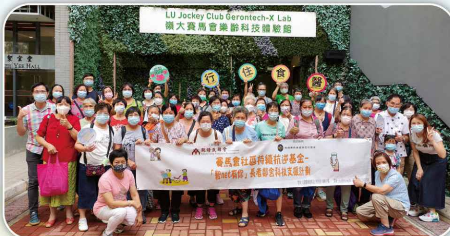
「智 NET 友里」舉辦參觀嶺大賽馬會樂齡科技體驗館活動時攝。