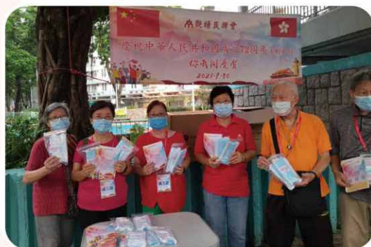
慶祝中華人民共和國成立 72 週年活動「你我同慶賀」, 並在觀塘各區派發防疫物資及小禮品。