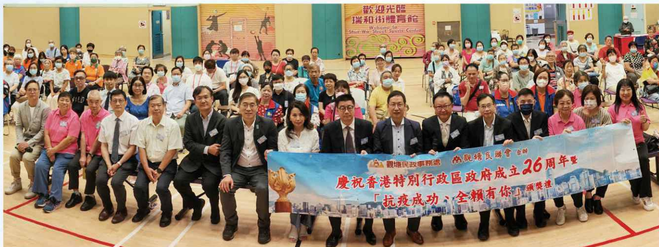
典禮情真意摯，盡顯精誠團結，愛國愛港之情十分濃烈！