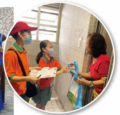
義工探訪長者並送上防疫物資！

是次活動邀請物理治療師、高級護士與專業人士和20多位計劃義工參與拍攝防疫資訊影片，影片超過40套(以微信/fb/Youtube等發送)。縱然在疫情最嚴峻下，居民仍能安坐家中收看資訊，又可按導師指導多做運動，倒覺寫意。