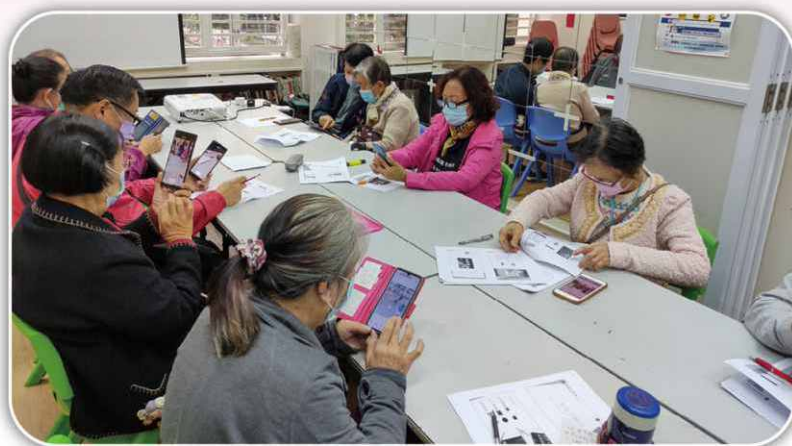
定期培訓義工如何使用智能手機。