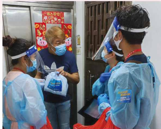
義工上門派送防疫包，市民無不額手稱慶。