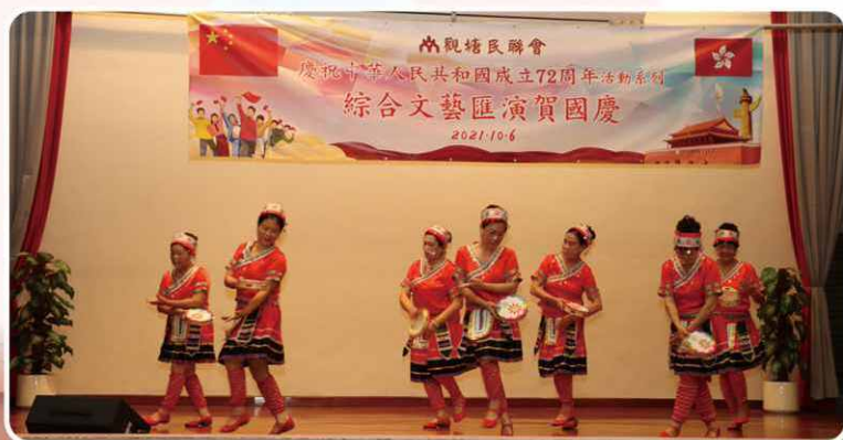
於啟業社區會堂舉行綜合文藝匯演賀國慶, 當中有民族舞表演。