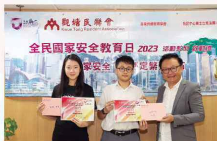
陳理事長與短片創作比賽得獎者合影。

以國家安全為題並透過短片創作，推廣和宣傳有關國家安全之重要性，藉此加深學生對國家安全的認識，參賽作品會用作社區宣傳和推廣國家安全教育的相關活動之用。