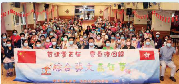
建黨百年文藝匯演嘉賓與參加者合照。

2021 年是我國共產黨建黨 100 週年。百年間，無數哲人先烈為中華民族復興作出貢獻，香港特區的發展及國家近數十年也同樣取得輝煌成就，這也與共產黨的領導息息相關，因此本會特在 2021 年 7 月舉辦建黨百周年活動系列，以座談會、綜合藝文匯演及青年發展高峰會等。以多元活動，引導不同階層市民多聽、多講、多認識我國共產黨的思想及其歷史發展。由於疫情所限，這活動系列約有多達 6,000 名市民參加。