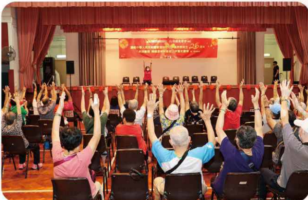
生活講座導師帶領在場參加者做運動、 抗抑鬱！