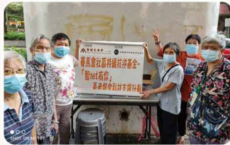
本會定期透過社區資訊站與居民聯繫，並解決其在使用手機時所遇到的問題。