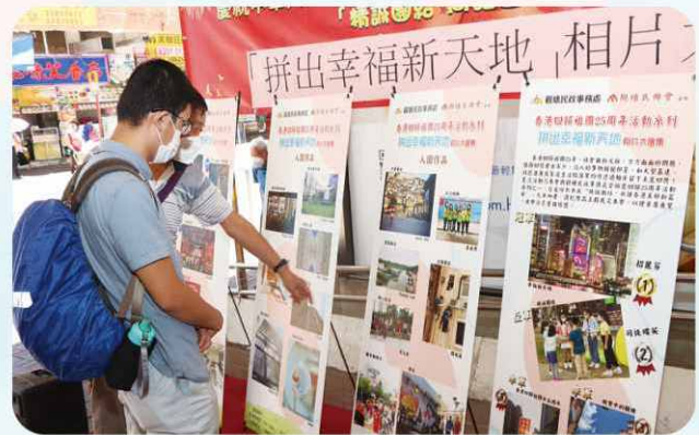
獲獎作品安排在裕民中心商場展出，觀賞者達6000人。