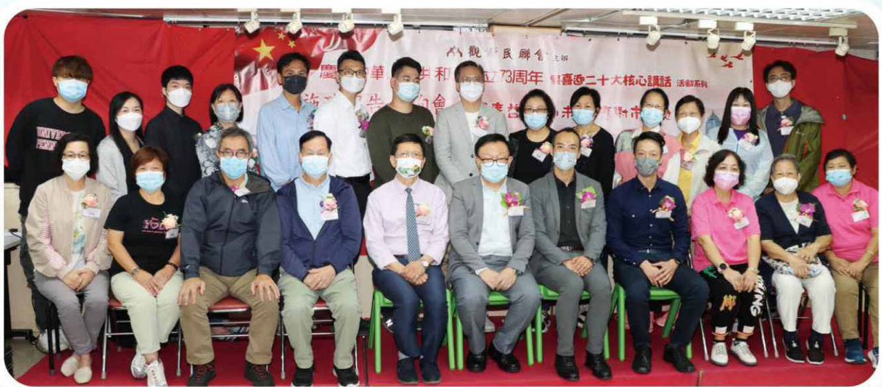
2022 年 10 月出席“學習二十大核心講話”的嘉賓與部份地區人士留影。