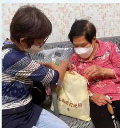
為基層長者送上防疫包，以解其燃眉之急。