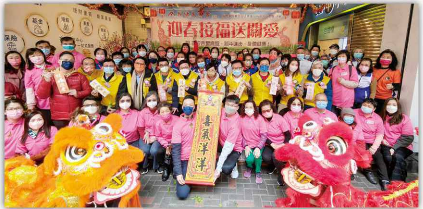
疫後第一個新年（2023），本會進行關愛大行動，近百義工出席，並有舞獅助慶，場面熱鬧。

本會長者服務委員會一直關注區內長者情況，每年舉辦多個關愛活動，如今年農曆年初四特為區內長者舉辦關愛大行動，以喚起市民對尊親敬長之關注。當日有勞福局局長孫玉涵、房屋局局長何永賢、立法會鄧家彪議員及觀塘區議會柯創盛主席親臨打氣。當日義工分成三小隊，在陳理事長陪同下，兩位局長及官員浩浩蕩蕩探訪區內劏房戶家庭，並了解其生活情況，兩位局長及官員之舉大獲街坊好評。