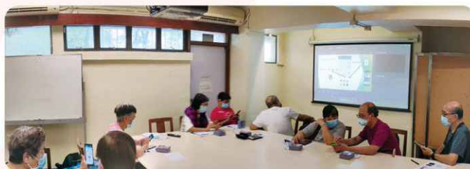
圖為長者在課堂上親身體驗樂齡科技帶來的便利和好處。

「智 NET 大使」嘗試自行設計樂齡科技體驗課程。當中包括應用智能手機、體驗樂齡科技產品、長者認知訓練和應用軟件學習等，使更多基層長者能接觸及明瞭樂齡科技的好處，受惠長者達 300 人。