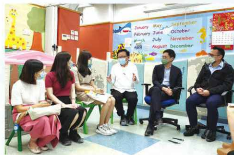
公務員事務局局長聶德權到訪觀塘民聯會翠屏兒童服務中心和學前兒童課餘託管中心（翠屏），探訪中心內的小朋友，並送上防疫禮物包以表關懷。