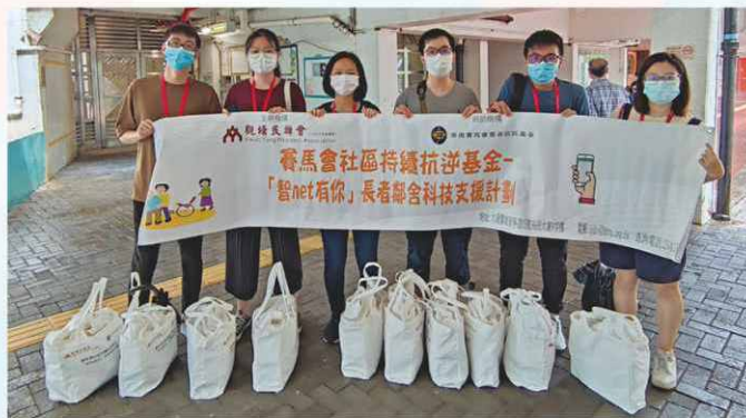
圖為智 NET 大使造訪居家長者，並跟進其對樂齡科技之使用情況。

修畢長者樂齡科技體驗課程後，本會將與「智 NET 大使」的參加者進行互相配對，智 NET 大使除定時致電和探訪長者外，亦會協助其使用智能手機應用程式等，藉此建立良好的鄰舍互助網絡。每名計劃義工將跟進參與體驗課程的長者，活動大受歡迎。