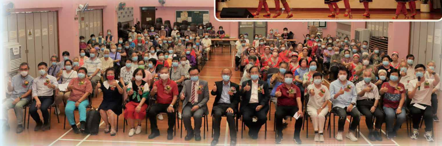
重頭戲除有「講好我和我的祖國故事」一拼高下外, 亦有舞蹈、歌唱等同慶中華人民共和國成立 72 週年。