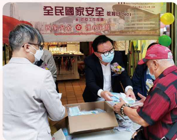
因疫情仍高企不下，本會於國家安全教育日活動後向區內居民送上口罩，合力遏止疫情蔓延！