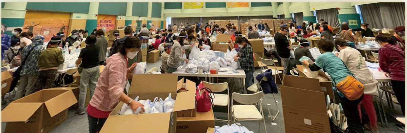
本會把義工分早、午、晚三更，並在瑞和街體育館合力包裝防疫物資時攝。