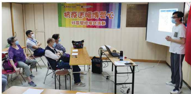
本會職員向義工講解「抗疫送暖傳愛心」計劃內容時攝。

2020年5月，本會向賽馬會申請「抗疫送暖傳愛心」計劃。本會義工逐戶上門造訪獨老、雙老及有需要的基層家庭，並為其送上應急物資，有約3,000戶長者及基層家庭受惠。