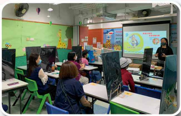
由營養治療師講解幼兒健康飲食知識。