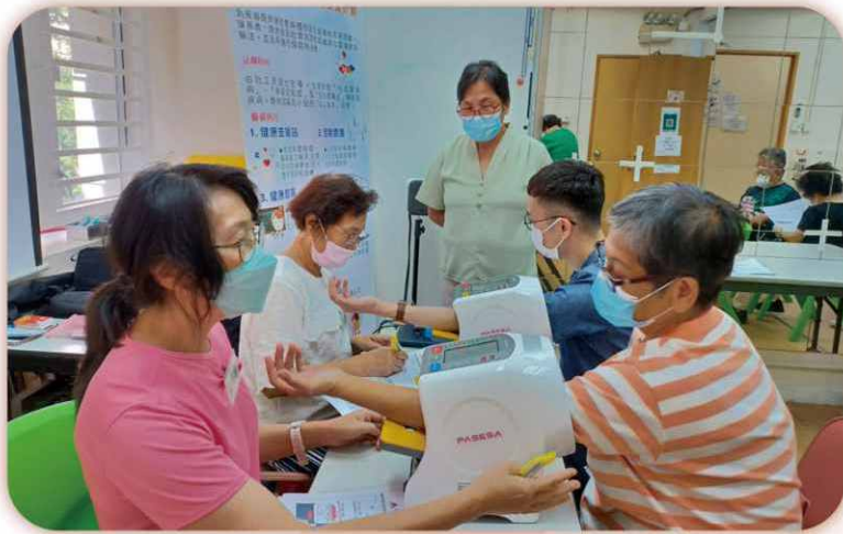
護士指導健康大使如何使用「血管硬度機」，以便在體檢時協助居民了解其血管的健康狀況。

步入晚年，長者身體容易因機能衰退而出現不同疾病！為了及早發現、及早醫治，本會組織「治未病」健康大使，透過身體檢查儀器，為區內長者進行簡單身體檢查，並以此推廣「治未病」的理念。