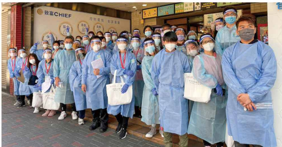
本會300多名義工於上門派送物資前分批留影。