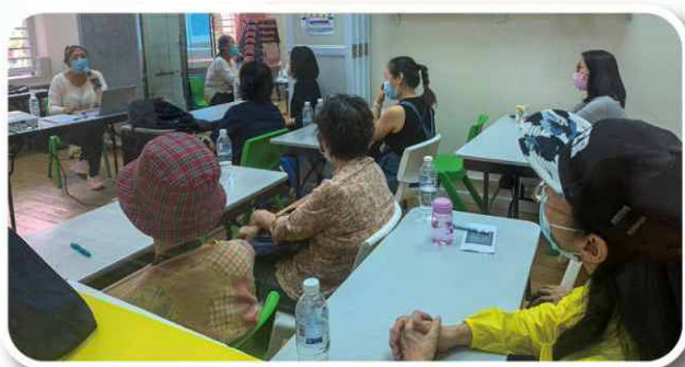
由護士培訓參加者有關幼兒護理知識。

幼兒中心定期安排護士、幼兒工作者、急救講師及營養治療師等培訓義工，加強學習新的照顧幼兒知識，以豐富社區保姆的實務，使其日後能為使用者提供更優質的服務。