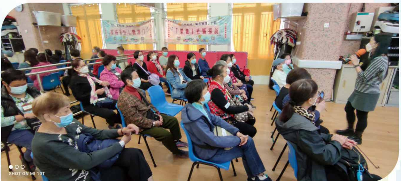
本會專業護士向義工講解日常長者護理注意事項。