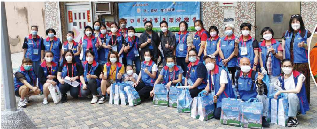
本會與女青年會(YWCA)Citywide 50+ 舉辦「愛心探訪」。圖為義工出發前留影。

本會在2020年初，邀請職業治療師拍攝運動短片，鼓勵長者在家做運動，及後更與觀塘家長教師聯會及女青年會(YWCA)Citywide 50+ 合作「愛心探訪」，向長者派發防疫物資。