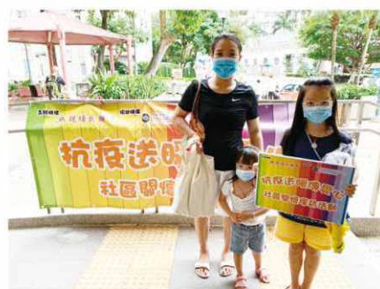
本會義工上門派發應急物資時攝。