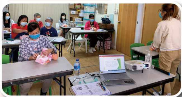
由幼兒工作者指導參加者如何照顧幼兒及其注意事項。