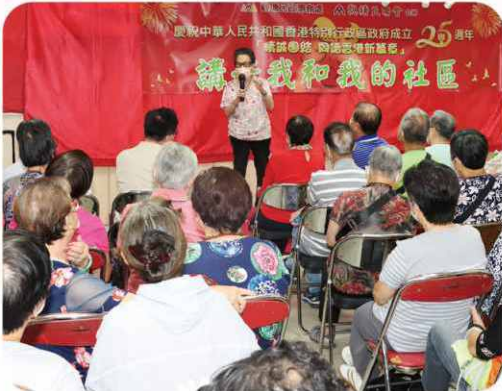
參加者講述自己的社區故事，十分感人！