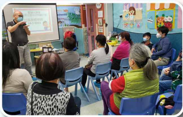
由豐富經驗導師講解幼兒患病時之照顧與急救知識。