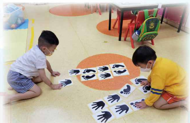
透過不同遊戲教材施教，效果良好。