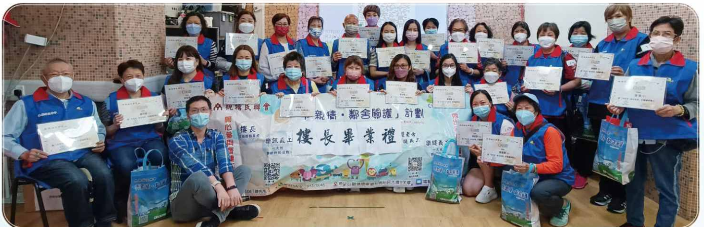
近 30 多名義工經連串培訓後，終於畢業成為樓長，希望他們能學以致用，得心應手。