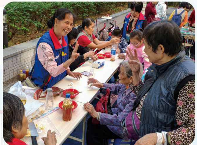
在義工的指導下，長者嘗試製作環保酵素，實踐「環保」大同。