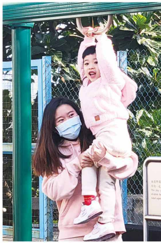
社區保姆協助有需要的家長照顧幼兒。

然而，在 2020-2022 的疫情期間，社區實施隔離政策，家長不願在中心托管幼兒，令服務嚴重受阻，保姆培訓工作亦因此停頓，但本會服務仍然繼續並沒有因此而怠慢；相反社區保姆十分積極面對逆境，與學童保持連繫，並不時致電慰問及送上防疫物資，彼此保持良好的人際關係；此外，亦定期聯絡學童家長，為其提供在家照顧兒童的專業意見，以紓緩家長憂慮。