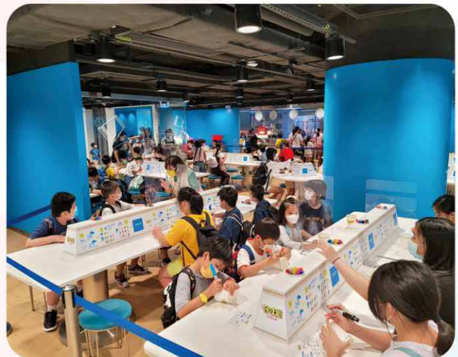
與學童參觀「合味道紀念館」，並在工作坊製作個人的合味道杯麵。