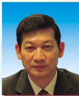
林建華博士 BBS, MH