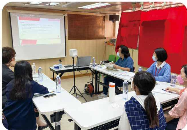
與基督教聯合那打素社康服務處商議復康轉介流程，發揮計劃在基層醫療的功能。