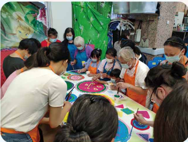
由家長、義工和長者一同 Circle painting，創意無限。