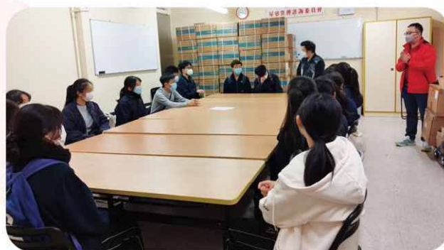
本計劃與油麗屋邨委員會和「創知中學」合辦長者探訪，傳遞關愛與關懷。圖為同學在統籌活動時攝。