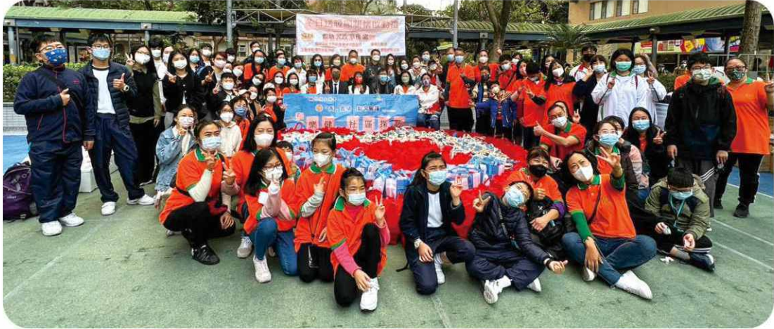
與觀塘家長教師聯會合辦探訪活動，讓區內不同院校學生共同推廣跨代共融的關愛精神。

本計劃定期與不同機構合辦探訪活動，讓不同年齡的人士和義工聯袂探訪有需要的長者，了解他們的生活情境，實現跨代共融的關愛精神。