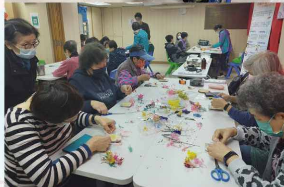
上圖為歌唱班和下圖為香薰蠟燭班。課程設計是幫助護老者紓緩身心疲累和生活壓力。