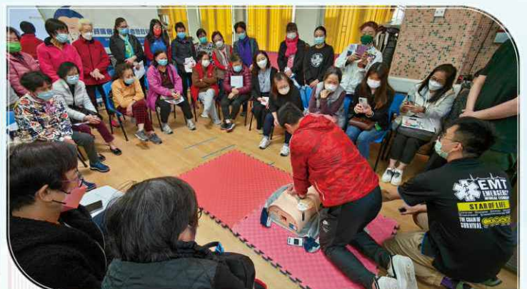
經一輪樓長培訓後，本計劃即安排進階課程，在課堂中邀請專業救護員教授急救常識。