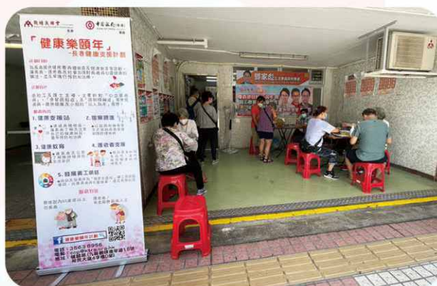
與啟業社區協進會和啟樂樓互委會合辦體檢服務，並宣揚「治未病」的訊息，大受參加者歡迎！