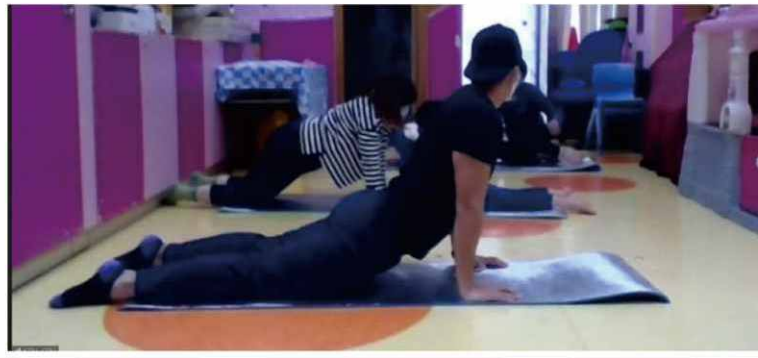
透過網上健體操班，讓學童能在本中心或家中也可鍛鍊身體、紓緩壓力。

本中心舉辦網上健體操及阻力帶運動班，由專業導師指導，讓參加者也可在家中鍛鍊身體和紓緩壓力。