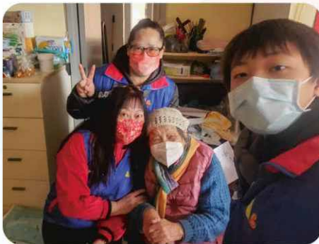
樓長和小義工於節日探訪長者並送上祝福和禮品。