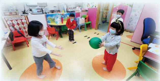
透過體能遊戲，強化小朋友大小肌的發展，並從中學懂遵守遊戲規則的重要性。