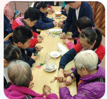
秀明小學一班學生與長者製作掛飾，彼此毫無隔閡。