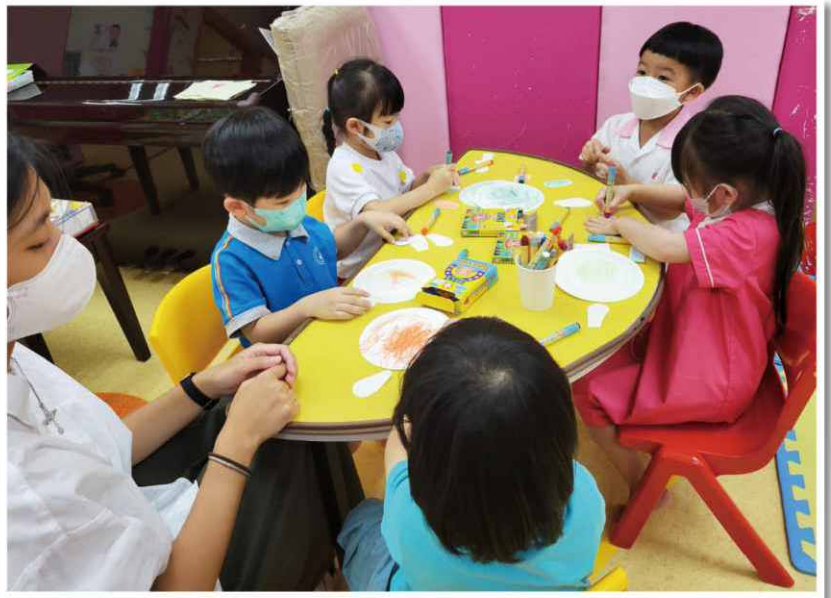
在活動中，學習人際禮儀。

服務初期，受制於疫情肆虐，舉步為艱，對各項工作影響甚大！尤幸在各同事靈活應變下，連結線上線下的宣傳，為區內有需要家庭提供新的服務模式，成效卓著。