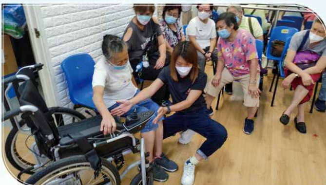
物理治療師教授義工協助輪椅使用者時應注意的事項和技巧。