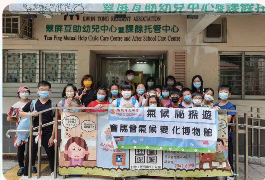
參觀全港首間氣候博物館，了解及認識氣候變化對人類的影響。此外，許多環保議題也引起小朋友的共鳴及關注！