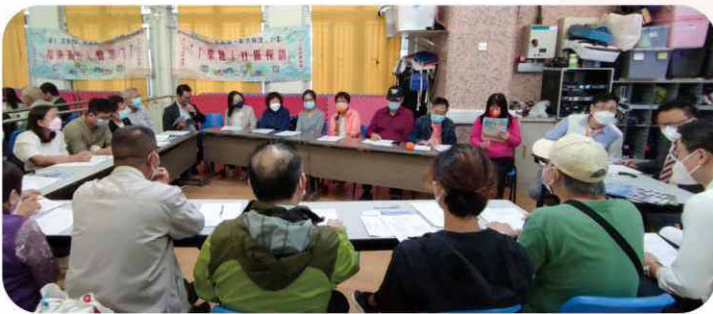
定期與團體舉行會議，集思廣益，共同為構建長者友善社區出力。

此計劃除培訓義工，推動市民參與外，還須連繫「醫、福、社、商、校」等團體，發揮跨界別優勢。是次參與團體，包括基督教聯合醫院、香港紅十字會東九龍總部、長者鄰舍中心、觀塘家教會、區內中小學校、地區團體、區議員及商業機構等超過 30 個不同單位，共同協作，並舉辦探訪、支援及關愛區內長者生活，其中包括運動、健康檢查與專題講座等多元活動。下圖為其中部份活動之剪影：