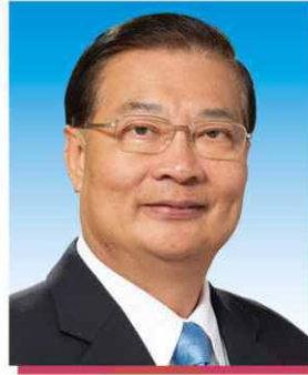
譚耀宗先生 GBM, GBS, JP