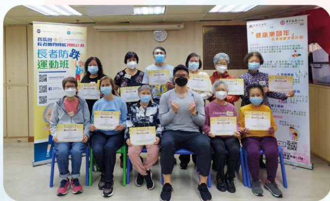
本計劃聯同香港賽馬會及中文大學合辦長者防跌運動班，課程非常實用。此外，導師亦協助宣揚「治未病」的訊息。