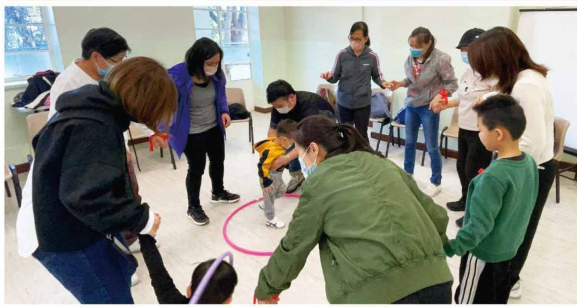
社區保姆帶同其照顧之幼兒在本中心一起參與活動。