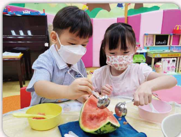
品嚐小食：學童親自制作及品嚐不同食物，從而提升其對食品的認識和語言表達的技巧。

在 2020-2022 期間，為阻止疫情的蔓延，學校不時停課，學童只能留在家中，這對他們的學業及社交成長影響甚大。面對這一挑戰，我們嘗試以線上功課指導及進行不同的線上小組互動，以新穎的內容配合影像傳播，並加入不同元素，增添學習趣味，務使學童能保持正向學習狀態。