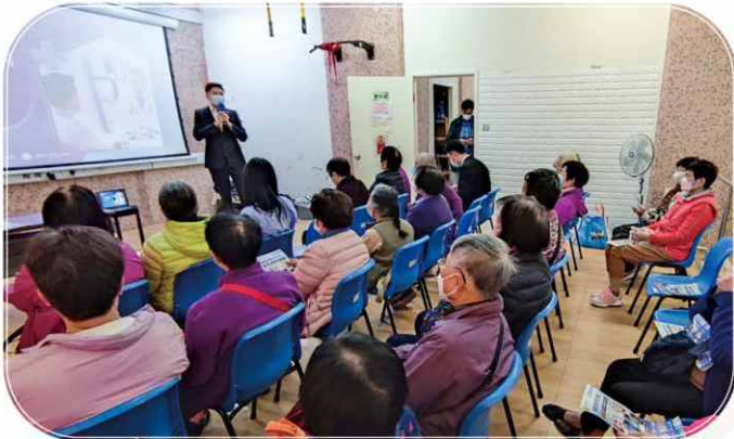
舉辦專題講座，讓義工了解更多醫療知識，從而帶給長者健康資訊。

本計劃定期舉辦義工培訓，主要是教授不同工作技巧，如探訪、面談及護理常識等，培養其成為樓長。除樓長培訓班外，還定期與不同單位舉辦進階課程，包括改善痛症運動班、中醫治療痛症班、芳療師痛症班、手機及 App 學習班、專題醫療講座、家居安全及健康檢查、防騙桌遊「錢爺爺的一天」導師培訓班等。