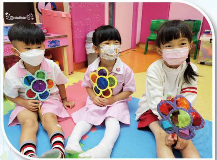
小朋友手持圖工互相讚美和欣賞。