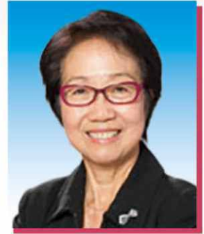
陳婉嫻女士 GBS, SBS, JP