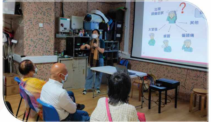
邀請資深護士教授義工簡單的護理知識。