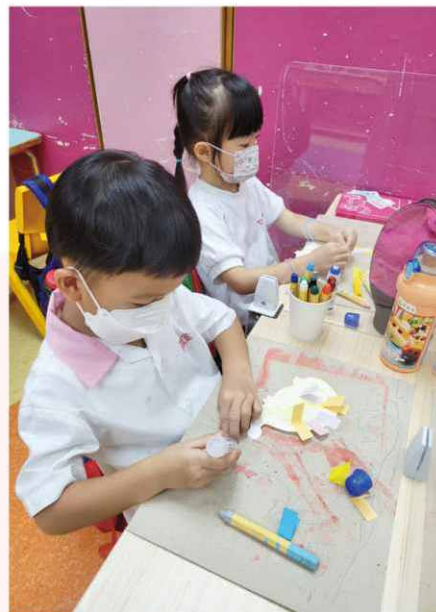
小朋友透過美勞活動，創造無限發展空間。

本中心於 2022 年開始由「互助幼兒中心」正式轉型為「學前兒童課餘託管服務」，因此由「觀塘民聯會翠屏互助幼兒中心」改名為「觀塘民聯會學前兒童課餘託管中心(翠屏)」，並一直致力為有照顧需要的家庭提供適切的服務，協助維繫有家庭情感需要的人士提支援，促進家庭和睦。