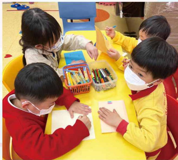
在圖工活動中，學習互相欣賞，從而懂得彼此尊重。