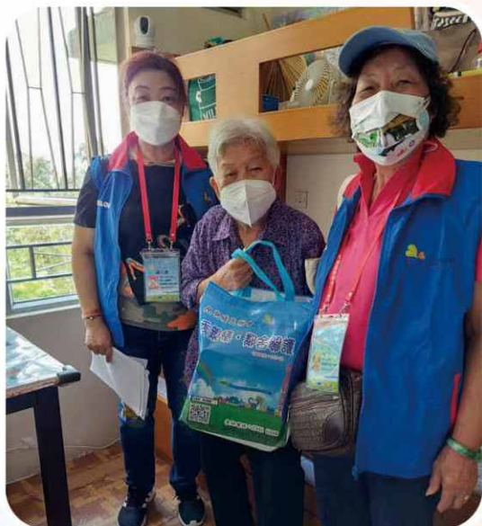
節日時向長者送上心意品，聊表關懷和與其分享節日之喜悅。