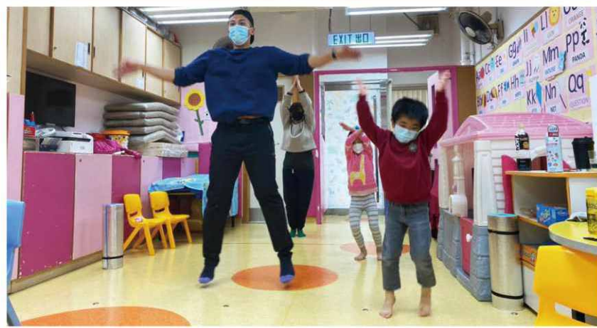
由專業體適能導師帶領小朋友一同做運動，讓其強身健體，此活動深受學生與家長歡迎！

在各人的努力下，本會在家庭及兒童服務方面取得一定的進展，成績有目共睹。2023年4月起本會亦獲社會福利署升格為受助團體。