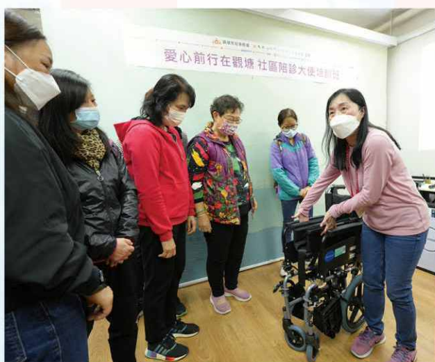
在工作坊上，專業護士向護老者教授如何使用輪椅、陪診技巧與其注意事項。