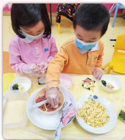
小食製作：學習不同食材配搭，鼓勵創意無限！