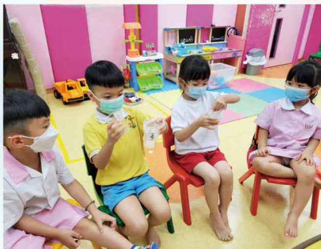
從主題活動中，培養自信，讓其懂得尊重及接納別人。