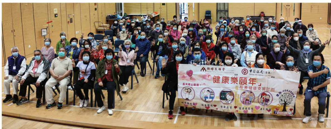
由計劃社工及護士主講「開心快樂晚年」講座；其主題圍繞怎樣照顧認知障礙症患者，並如何從其心理角度增強患者記憶力及協助護老者加強專業知識與技能。

本計劃定期為護老者提供協助及支援，並針對主題舉行活動，以提升護老者的照顧技能，減輕他們的憂慮及負擔，同時亦協助其建立友輩支援網絡。此外，也透過舉辦不同的身、心、社、靈活動，以支持和鼓勵護老者，並予以肯定他們對家庭及社會的價值與貢獻。