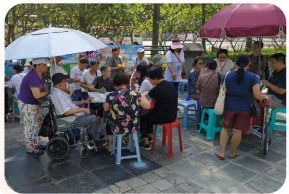
與聯合醫院合辦體檢，了解長者健康狀況。