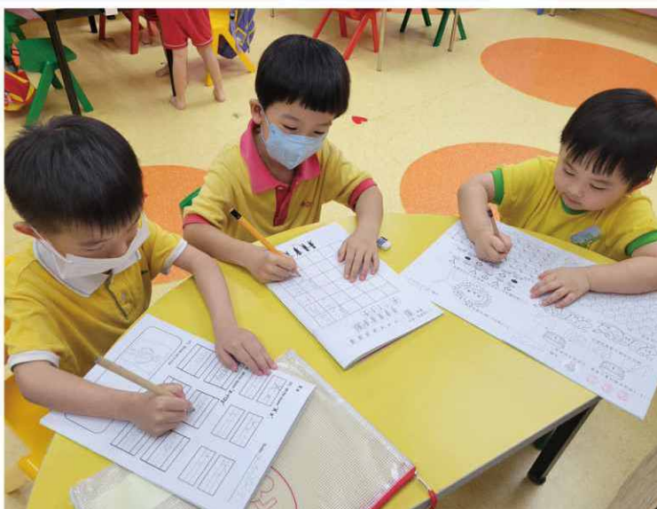
以功課輔導形式，共同學習，促進成長。