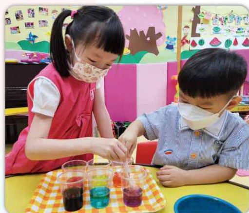
科學實驗：提升其理解力，培養對科學探索的興趣，並在合作過程中，學習互相尊重和成果分享。