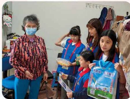
於探訪長者時，樓長和小義工送上親手製作的心意卡，場面溫馨。