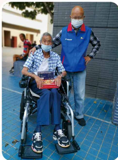
義工陪伴輪椅長者外出，包括陪診、購物等，無微不至！此項服務大受好評！本會謹此向有關義工致謝！