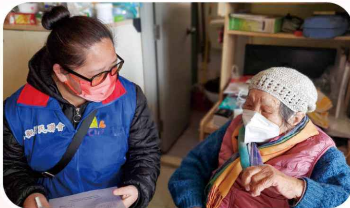
義工定期探訪，以了解長者日常生活狀況。

截至 2023 年 5 月，本計劃已探訪超過 280 名長者。其服務主要是為長者提供生活及精神上的支援，包括每月約二次上門或電話閒聊，藉此介紹社區資訊、鼓勵其多做運動和彼此分享。此外，也協助有需要長者購買生活用品、陪診、家居清潔等。長者能夠通過此項服務，在健康和安全的的生活層面上接收更多資訊，對應其在生活的支援，有助「居家安老」之成功推廣。