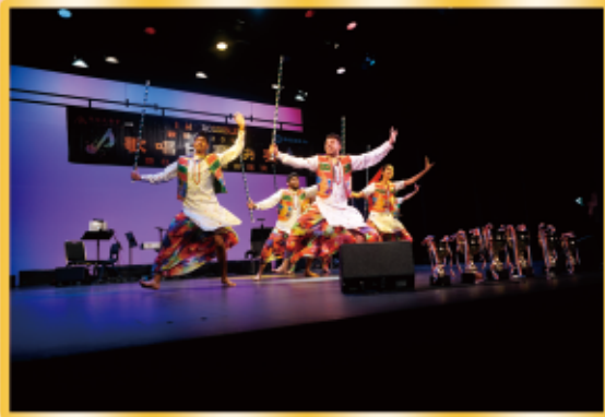
印度舞蹈表演為決賽項目錦上添花！

由本會主辦，觀塘區議會贊助的「觀塘區2018歌唱比賽」決賽暨社區文化匯演於2018年12月9日在牛池灣文娛中心完滿結束。入圍參賽者施展渾身解數將美妙聲發渾得淋漓盡致。