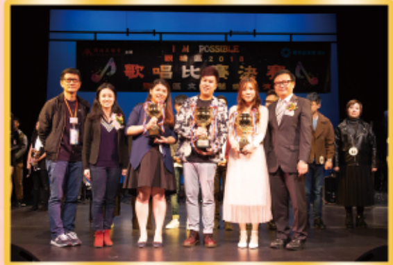
「觀塘區2018歌唱比賽」獲獎者出爐！

今年活動更走到社區接近街坊，我們在淘大商場及安泰邨籃球場舉行戶外音樂會，當日有決賽入圍者、歌唱技巧班學員和歌唱愛好者表演，演出者盡情發揮表演才華，街坊看得歡樂盡興。